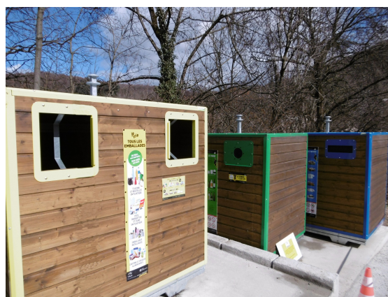
Premiers tests d'implantation