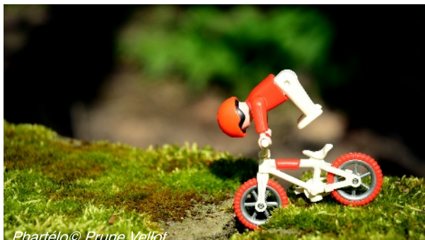
Phartélo© Prune Vellot

À la demande, elle organise aussi ponctuellement des ateliers autour de la photo , de l'écriture et du vélo .