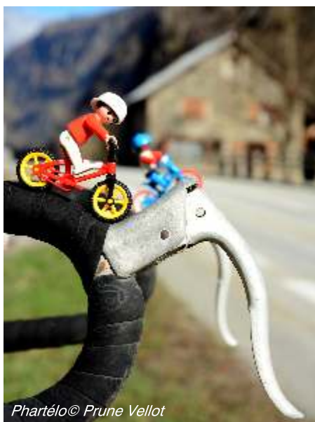
Phartélo© Prune Vellot