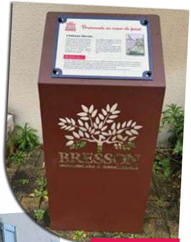
Panneau du château Mottet

Le groupe patrimoine, sous l'impulsion de l'adjointe Hélène Margueritte, souhaite proposer à moyen terme un circuit patrimonial du village. Une dizaine de ces panneaux sont prévus ainsi que d'autres formats. Le prochain panneau concernera le bâtiment appelé "Mairie-École" situé rue de l'Église. Les recherches sur cette belle maison construite en 1876 sont productives et ont permis de belles découvertes sur notre village.