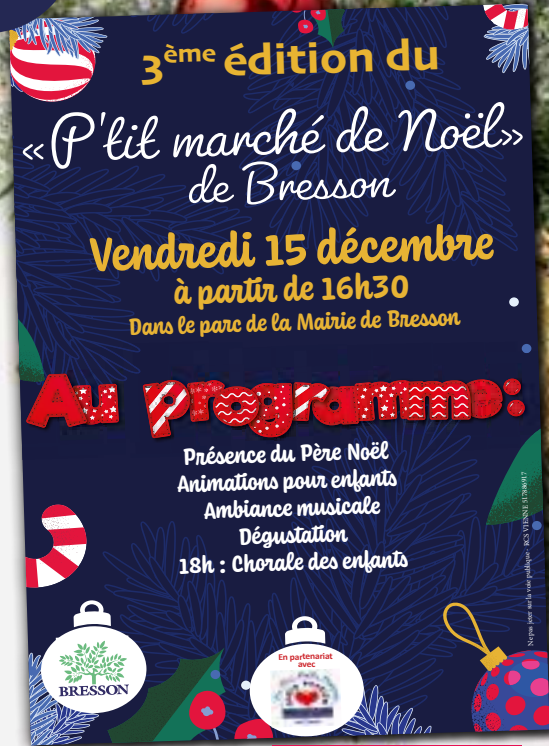
Affiche marché de Noël

Le site internet s'est fait une beauté pour les fêtes. La carte de vœux avec une invitation à la cérémonie des vœux sera remise à chaque famille bressonnaise.