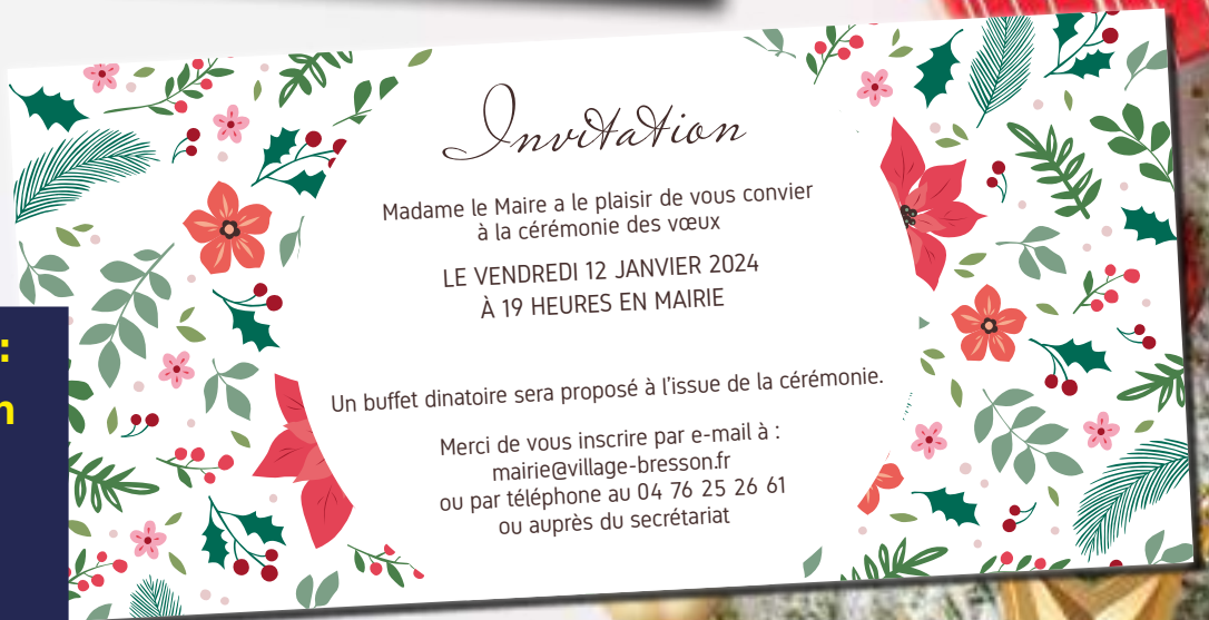
Invitation à la cérémonie des vœux

ATTENTION : Inscription en mairie au plus tard LUNDI 8 JANVIER.