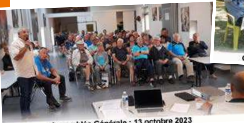
Assemblée Générale : 13 octobre 2023

Tous les Bressonnais attirés par cette activité sont invités à nous rejoindre pour deux ou trois séances d'essai avant une éventuelle confirmation de demande d'adhésion. Il suffit de demander à rencontrer un membre du bureau (coordonnées sur le site de la mairie).