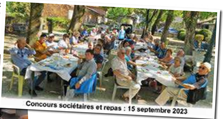
Concours sociétaires et repas : 15 septembre 2023