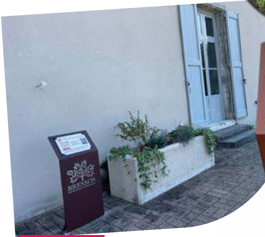
Le panneau devant la mairie