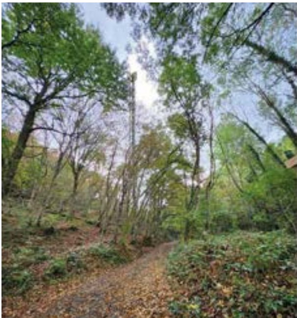
Vue de l'antenne jointe à la DP

Conscient de ce risque et sachant que les maires ont très peu de pouvoir pour s'opposer à une implantation d'antenne, le conseil municipal, à l'unanimité , a décidé d'autoriser l'implantation au niveau du réservoir de la voie romaine car elle était la plus éloignée des habitations tout en convenant d'un point de vue technique à l'opérateur qui a déposé une D.P. (Déclaration Préalable) sur ce site.