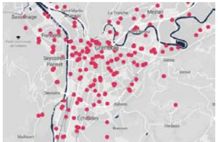
Schéma des antennes 5G existantes dans le bassin grenoblois. Source : https://www.ariase.com/mobile/carte-antennes