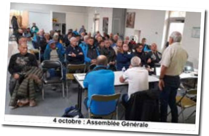
4 octobre : Assemblée Générale

Tous les Bressonnais attirés par cette activité sont invités à nous rejoindre pour deux ou trois séances d'essai avant une éventuelle confirmation de demande d'adhésion. Il suffit de demander à rencontrer un membre du bureau (coordonnées sur le site de la mairie).