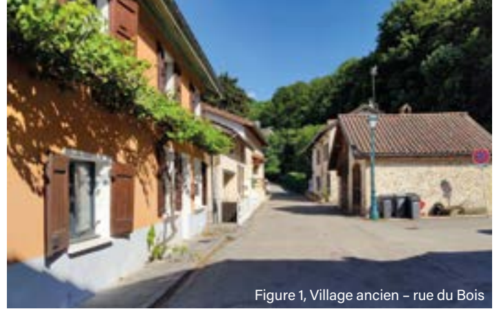
Figure 1, Village ancien - rue du Bois

Le secteur autour de la rue de la République et de la rue de l'Oratoire (Bernardière, Sous-Georges et Pré-vert) est désormais dans la zone UD3.