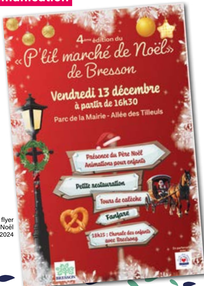
Affiche & flyer Marché de Noël 2024